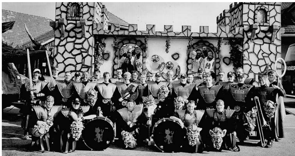
Bild: Guggi Zunft zu Olten an der Fasnacht 2002 in Langenthal..

PS: wir von der LFG danken der Guggi Zunft Olten für die immer wieder tollen Sujets, welche sie uns am Langenthaler Fasnachts-Umzug Jahr für Jahr präsentieren. Auf dem aktuellen NIUS-Umschlag ist das Sujet 2016 der Guggi Zunft auch abgebildet.