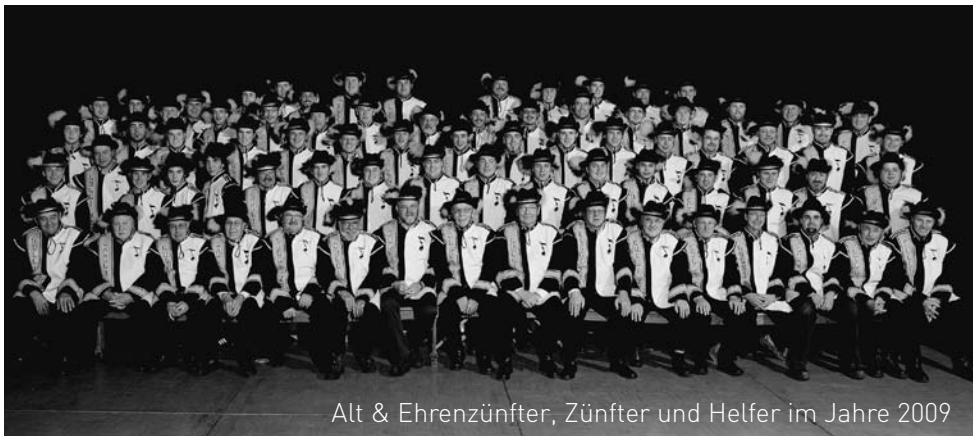
Alt & Ehrenzünfter, Zünfter und Helfer im Jahre 2009

rung der FUKO in Olten entsprechend belohnt. All diese Aktivitäten haben unser 60 Jahre Jubiläum zu einem besonderen Meilenstein im Zunftleben gemacht und die Mitglieder noch mehr zusammengeschweisst.