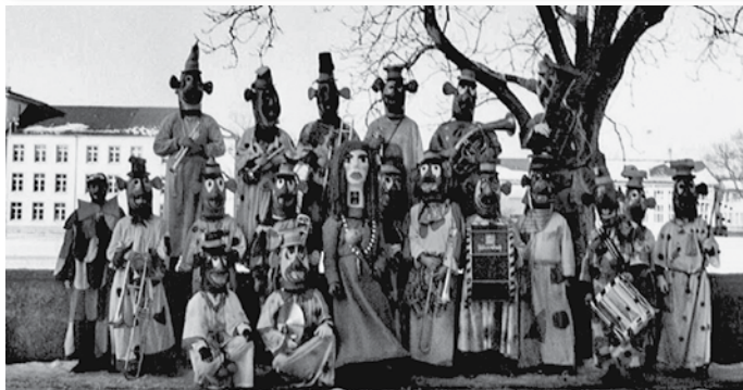
Erstes Gruppenbild der Chlepf-Schitter aus dem Jahr 1985 (oben), Tambourmajor 2012 am Umzug in Visp (rechts).