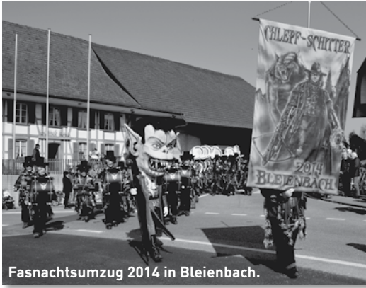
Fasnachtsumzug 2014 in Bleienbach.

aus. Hinzu kommt eine Affinität für eher düstere Fasnachtsmottos, was sich in den Kostümen und Masken niederschlägt. Felle, Nieten und Stoffe in Lederoptik wurden in den letzten Jahren zum Markenzeichen. Dementsprechend blieb der Überraschungseffekt an der Fasnacht zwar teilweise auf der Strecke, der Wiedererkennungswert dagegen stieg.