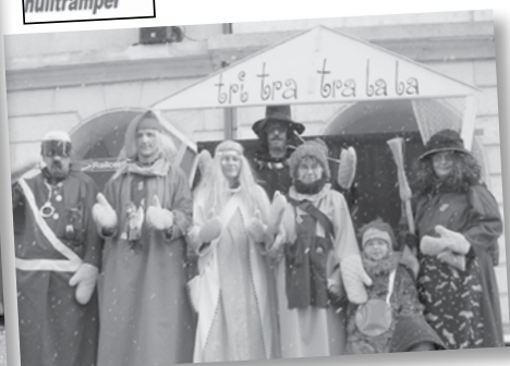
2005: Tri-Tra-Tral la la