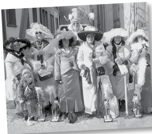
2004: Ascot Ladies