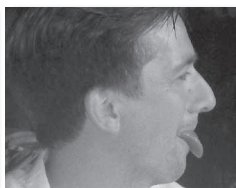
Mann zeigt wieder Zunge...