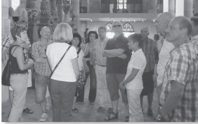
Aufmerksame Zuhörer am Stadtrundgang