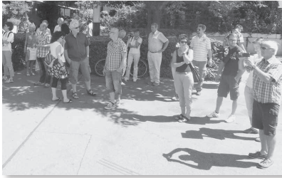
Unser Ziel: die Fasnachtshochburg Basel