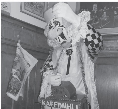
Fasnachtsmuseum, ein Muss für Fasnächtler