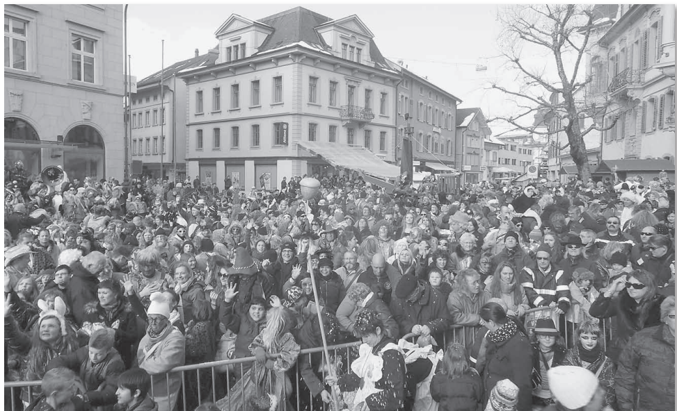
Alle Bilder vom Fasnachtsfischen 2013

Und es scheint nun, dass dieses Fischen aus dem Weiher im Laufe des Jahrhunderts zu einem großen Volksvergnügen wurde, denn der Inhaber der Fischrechte bot zum Verkauf der Fische auch Wein an und engagierte jeweils eine Musik, die zum Tanz aufspielte. Eigentlich war ein solches Treiben in den Chorge-