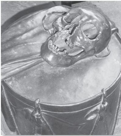
Spannendes und Grusliges