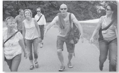
Happiger Aufstieg auf die Sissacher-Flue