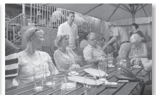
Ein Bier für Geniesser... ..und langenthaler Fasnächtler