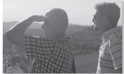
Na dann schauen wir mal...