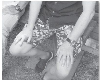
Mann zeigt wieder weisse Beine (gäu Reto)