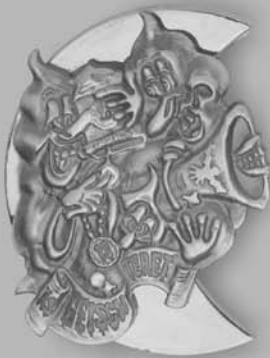
Gold Fr. 30.00