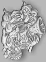
Bijou Fr. 30.00