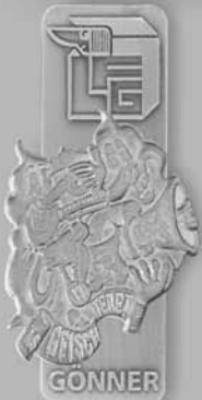
Gönner Fr. 100.00