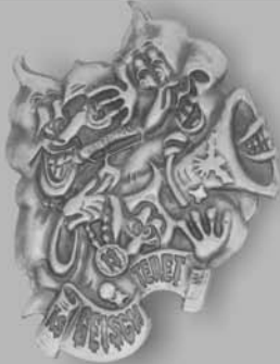
Kupfer Fr. 10.00

Erhältlich in diversen Ladenlokalen und Beizen im Stadtzentrum.