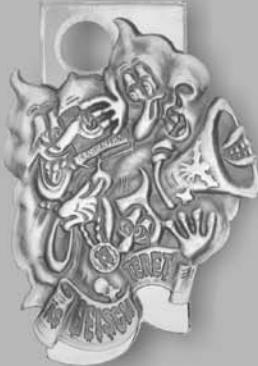
Silber Fr. 15.00