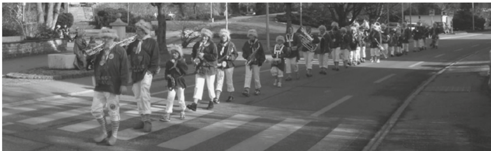
Typische Fortbewegung: Die Langedaaler Fiel-Harmoniker beim Gässlen im traditionellen Gänsemarsch.