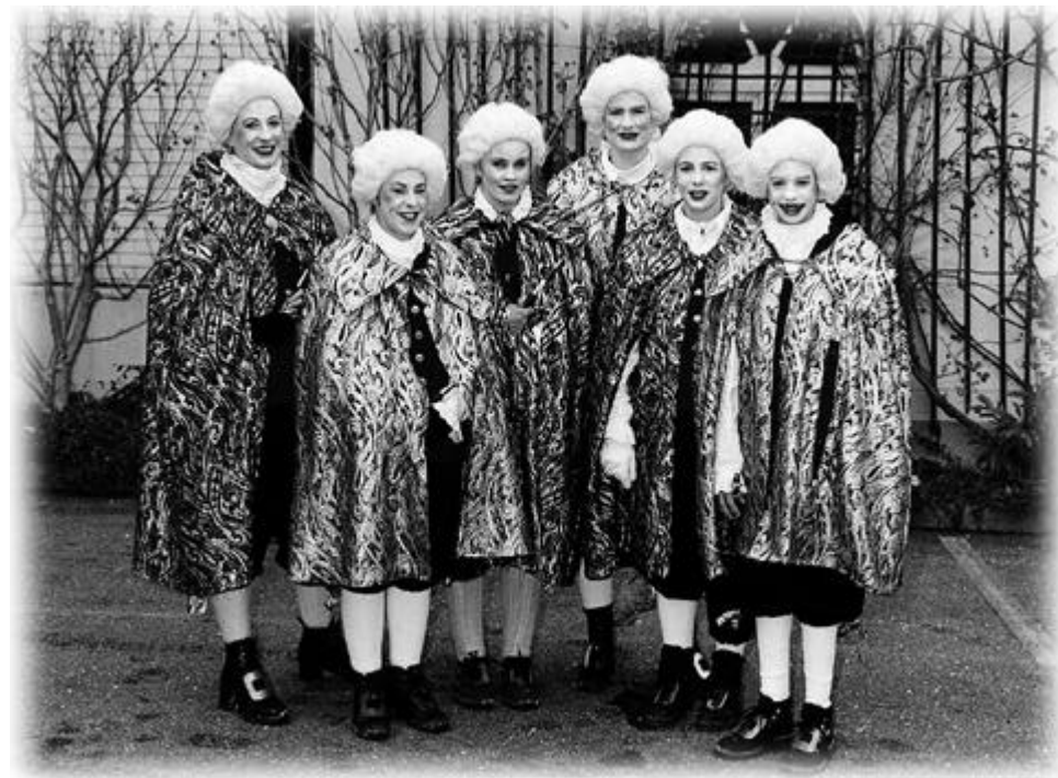
Foto der Whisky-Soda-Clique

Unser Jubiläum an der Fasnacht 2002 rückt näher. Wir kommen mit einem speziellen Kostüm daher und unsere Ideen überschlagen sich, wenn wir üben oder an den Näh-Weekends zusammenkommen. Was wir verwirklichen, könnt Ihr an der Fasnacht 2002 sehen. Bis dann!