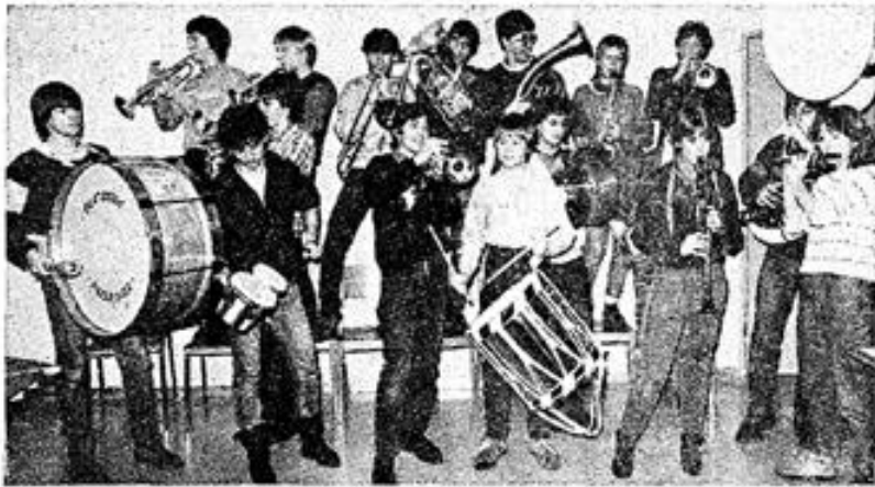
Eintritt am Oben für ihre Premiere: Die neue Langenthaler Fasnachts-„Pouseblooser“.